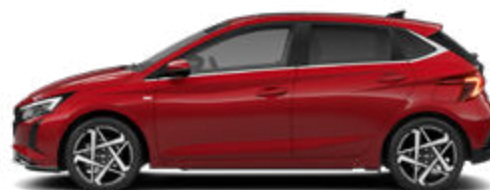
Dragon Red Pearl Kontrastdach verfügbar