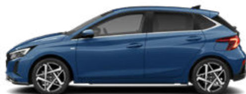
Vibrant Blue Pearl Kontrastdach verfügbar