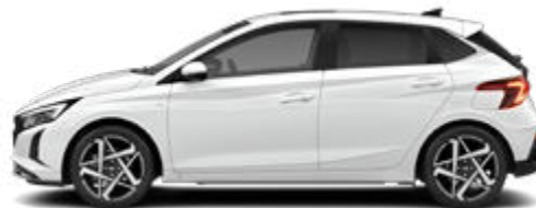
Atlas White Kontrastdach verfügbar