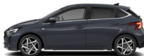
Aurora Gray Pearl