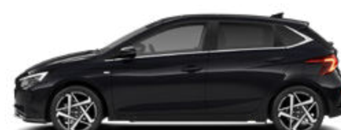
Phantom Black Pearl