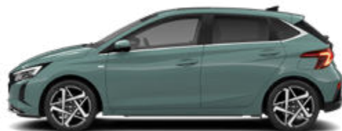
Mangrove Green Pearl Kontrastdach verfügbar