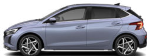
Meta Blue Pearl Kontrastdach verfügbar