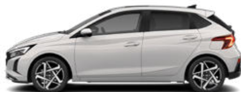
Lumen Gray Pearl Kontrastdach verfügbar