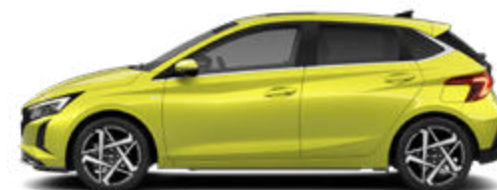
Lucid Lime Metallic Kontrastdach verfügbar